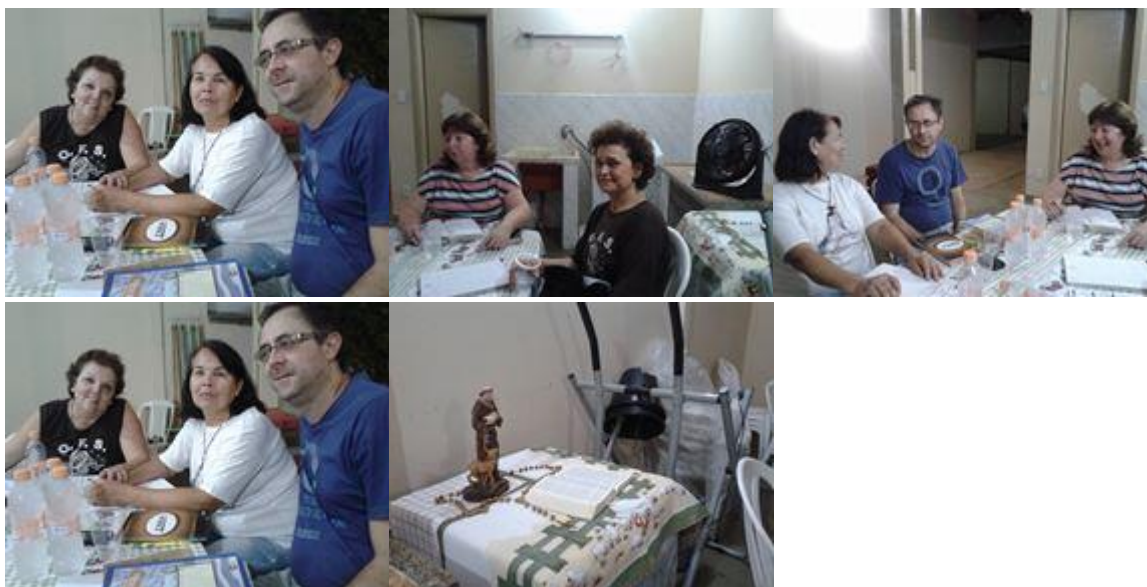
21 – Bazar no Pq. Ideal